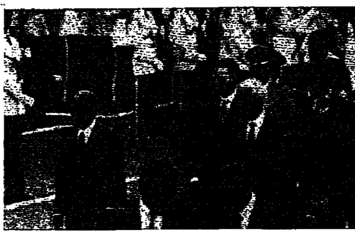
بن جديد يستقبل الحسن الثاني ابل الاجتماع

واوضح عون للوفد العربي - وفق المعلومات التي تسربت عن اللقاء - انه يطلب هذه الضمات من سوريا واللجنة الثلاثية والهاواي والحص، لان الدين المعروض عليه، ابغى اليه انه صيغ بفتح قلبه في الوقت نفسه، ويحتم سؤاليته الوطنية لا يمكن ان يرين ان حول غير مرتبطة بتلحاح حاسمة وملحومة، وعلى مستوى الازمة اللبنانية ككل.